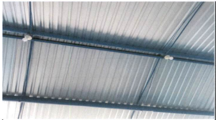
Foto 2: Sustitución de lámina, por lámina troquelada aluzinc calibre 26